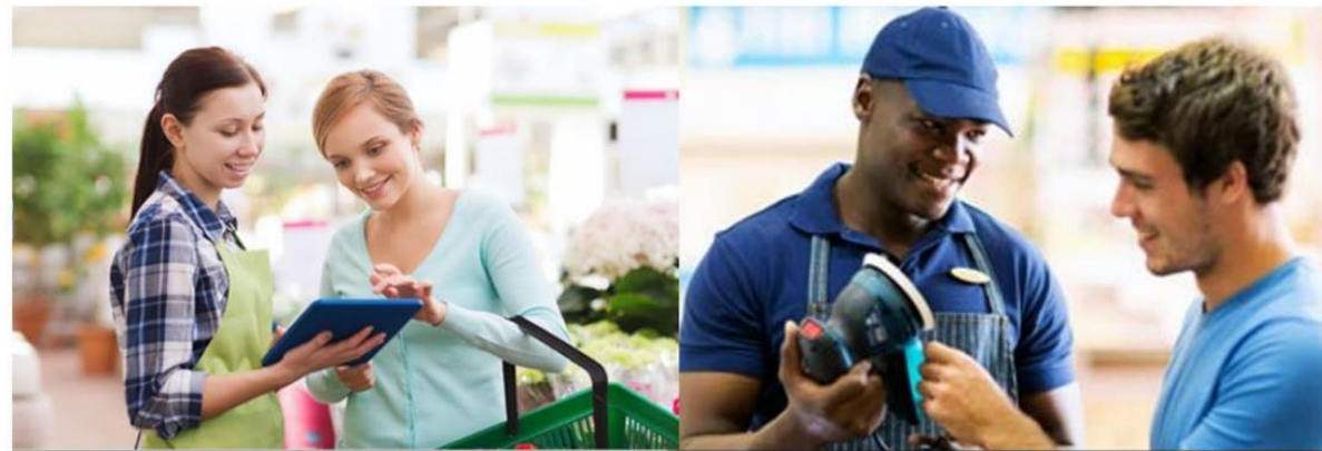
EQUIPIER POLYVALENT DU COMMERCE